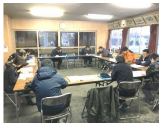
普通救命講習会・安全教育実施