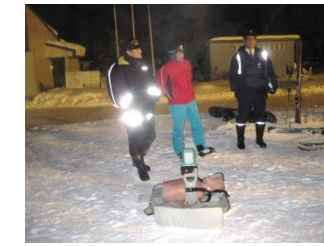
消防、警察及びパトロール員と連携して実施している救助訓練（ゲレンデ事故想定）