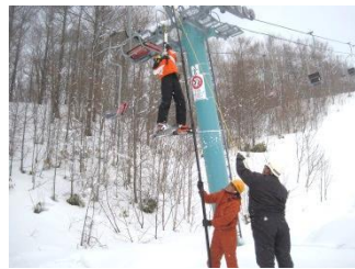
夜間：従事者、昼間：子どもでのリフト停止時の救助訓練